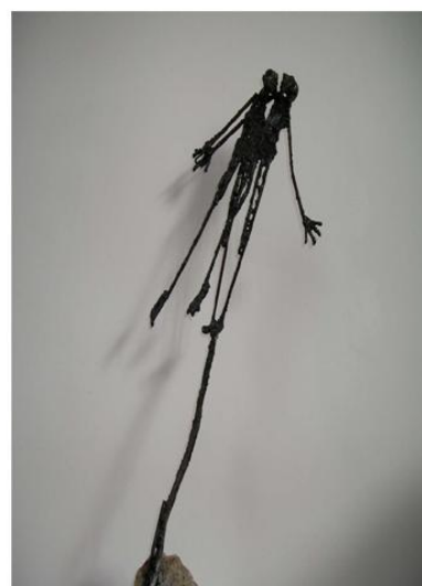
Déhanché Le penchant